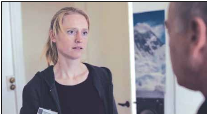
Scene fra filmen 'Hjemme hos Morten'.